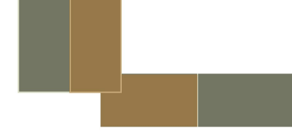
03 UNA VIVIENDA

UNA (RE)INTERPRETACIÓN DE LOS ELEMENTOS DE LA MARTELLA PARA VIDA MODERNA EN LA CIUDAD PERO CON LAS VENTAJAS DEL CAMPO