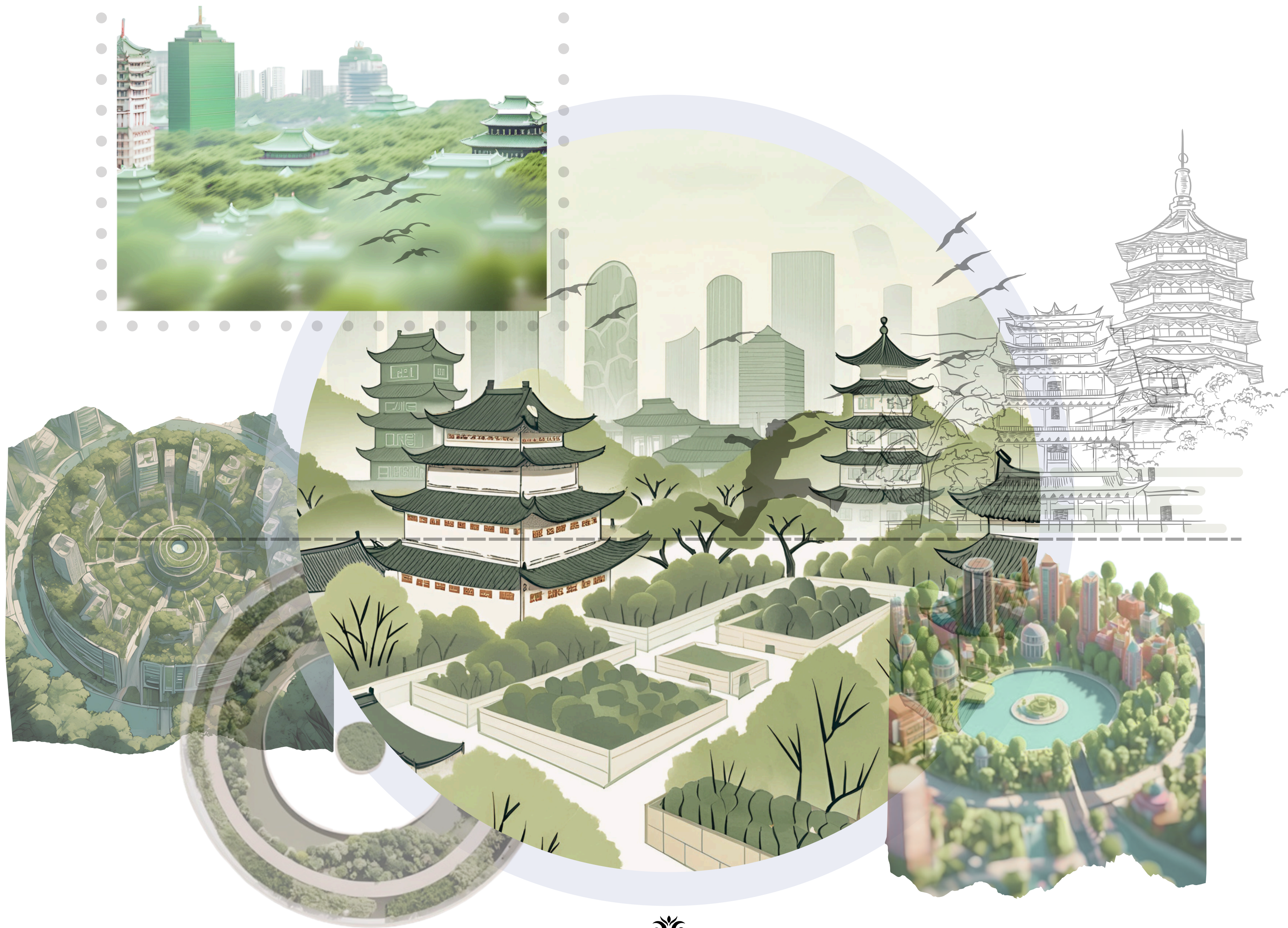
Ciudad de la Vida: Pekín, Naturaleza y Progreso en Armonía