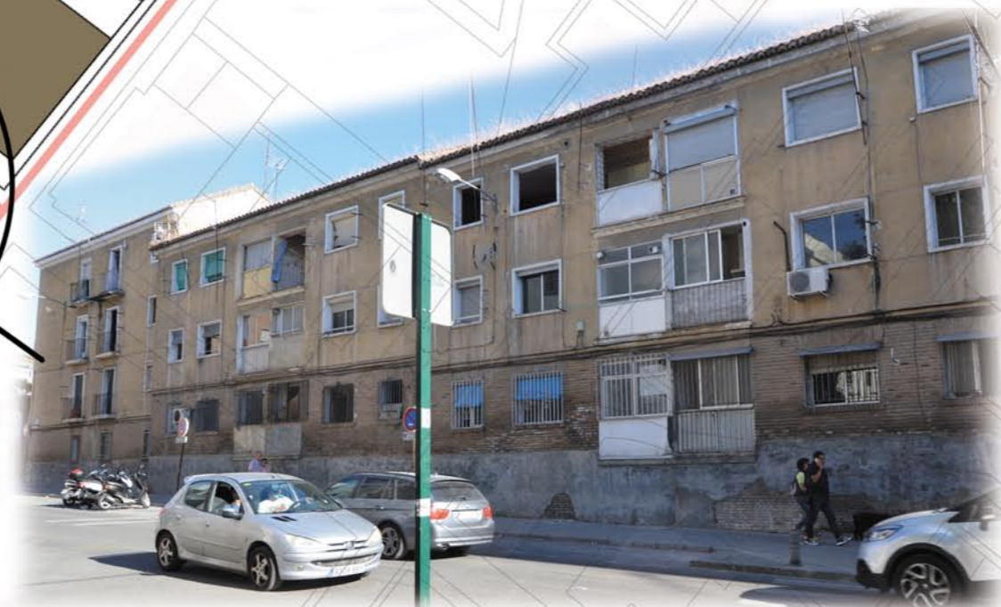
Edificio en ruina a rehabilitar. Tiene un gran tamaño y se encuentra en uno de los ejes que se van a peatonalizar, concretamente en la Calle Gracian. Es un edificio con muchas posibilidades tanto por la ubicación como por la embergadura que tiene la parcela que ocupa.

Una vez peatonalizadas las mencionadas calles, se pretende completar el barrio alrededor de éstas. Además contamos con un enorme solar vacío que tiene muchas posibilidades para crear nuevos usos en la zona.