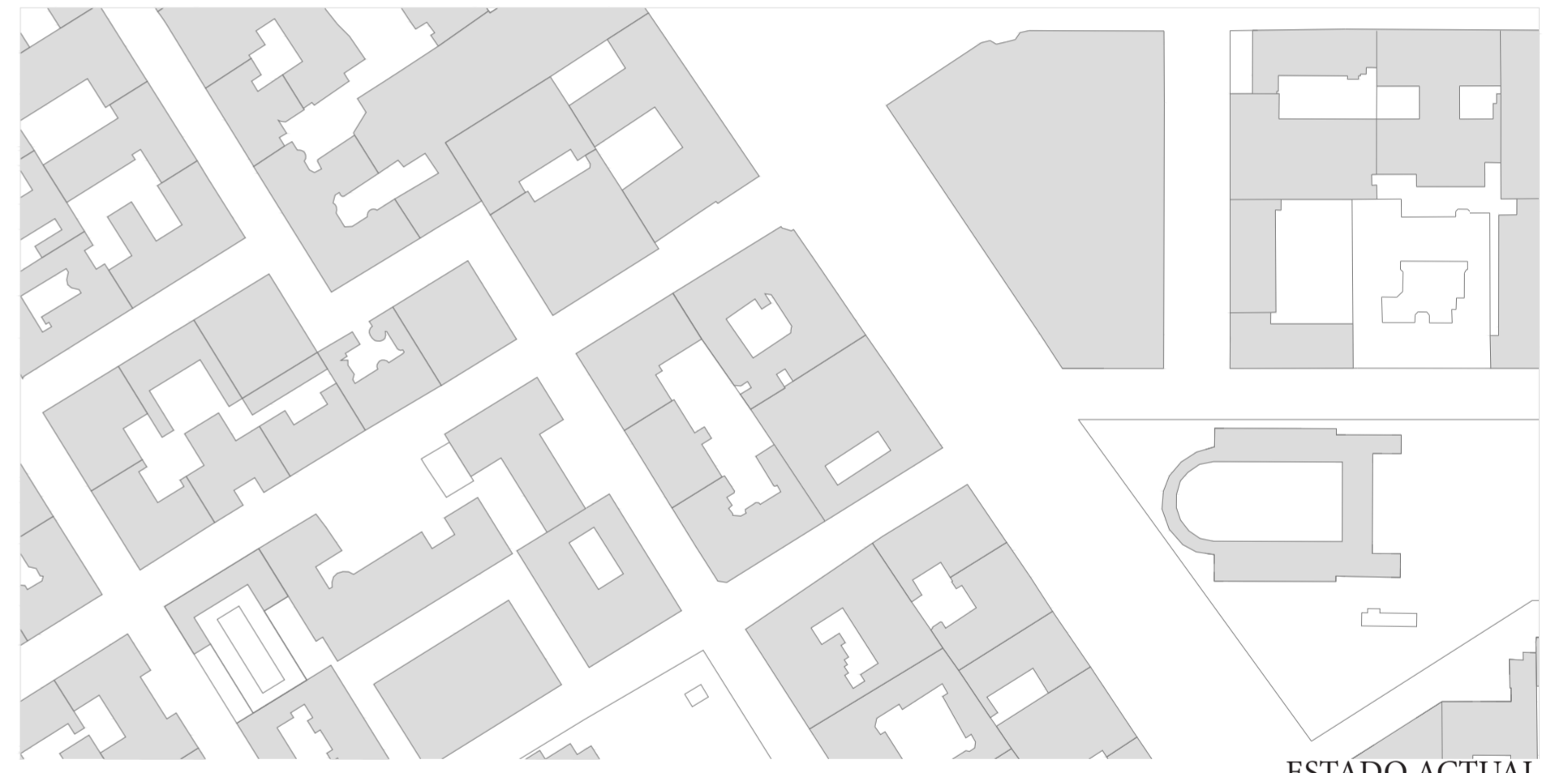
ESTADO ACTUAL ESCALA 1:2000