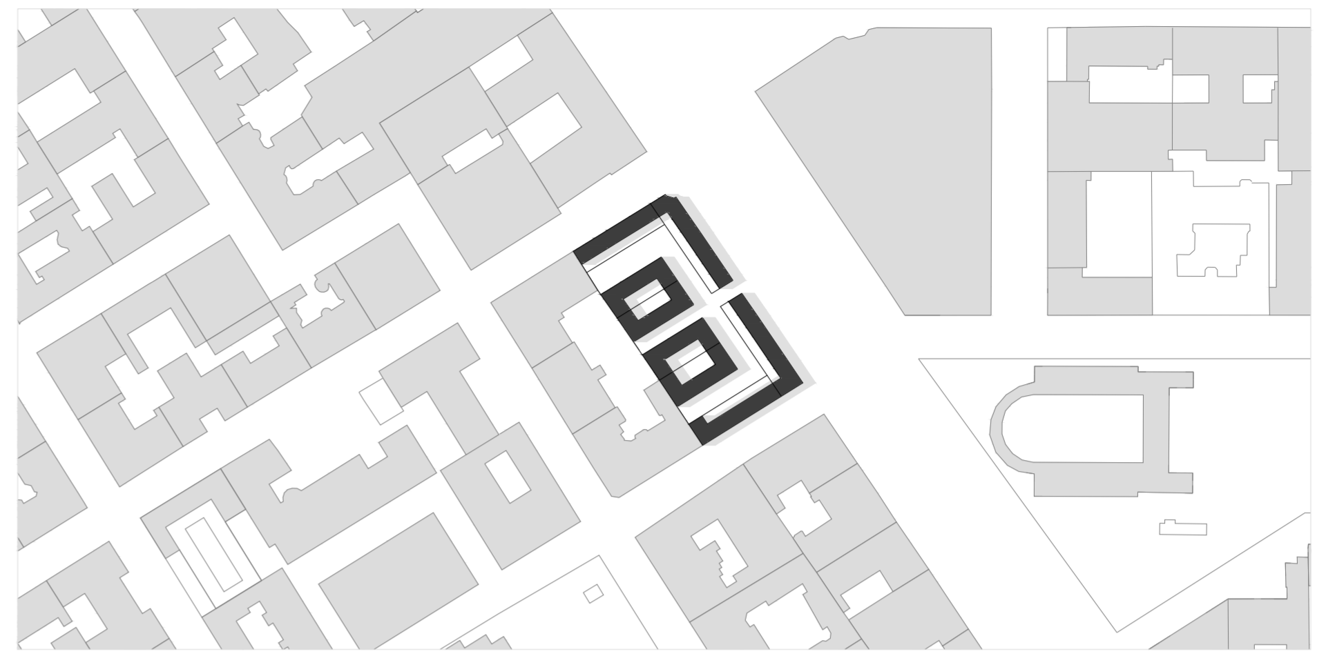
INTERVENCIÓN ESCALA 1:2000