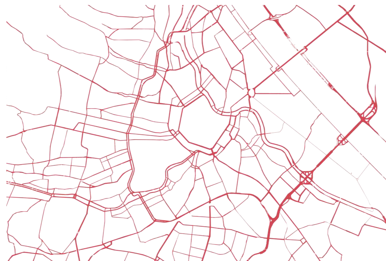
Redes de circulaciones