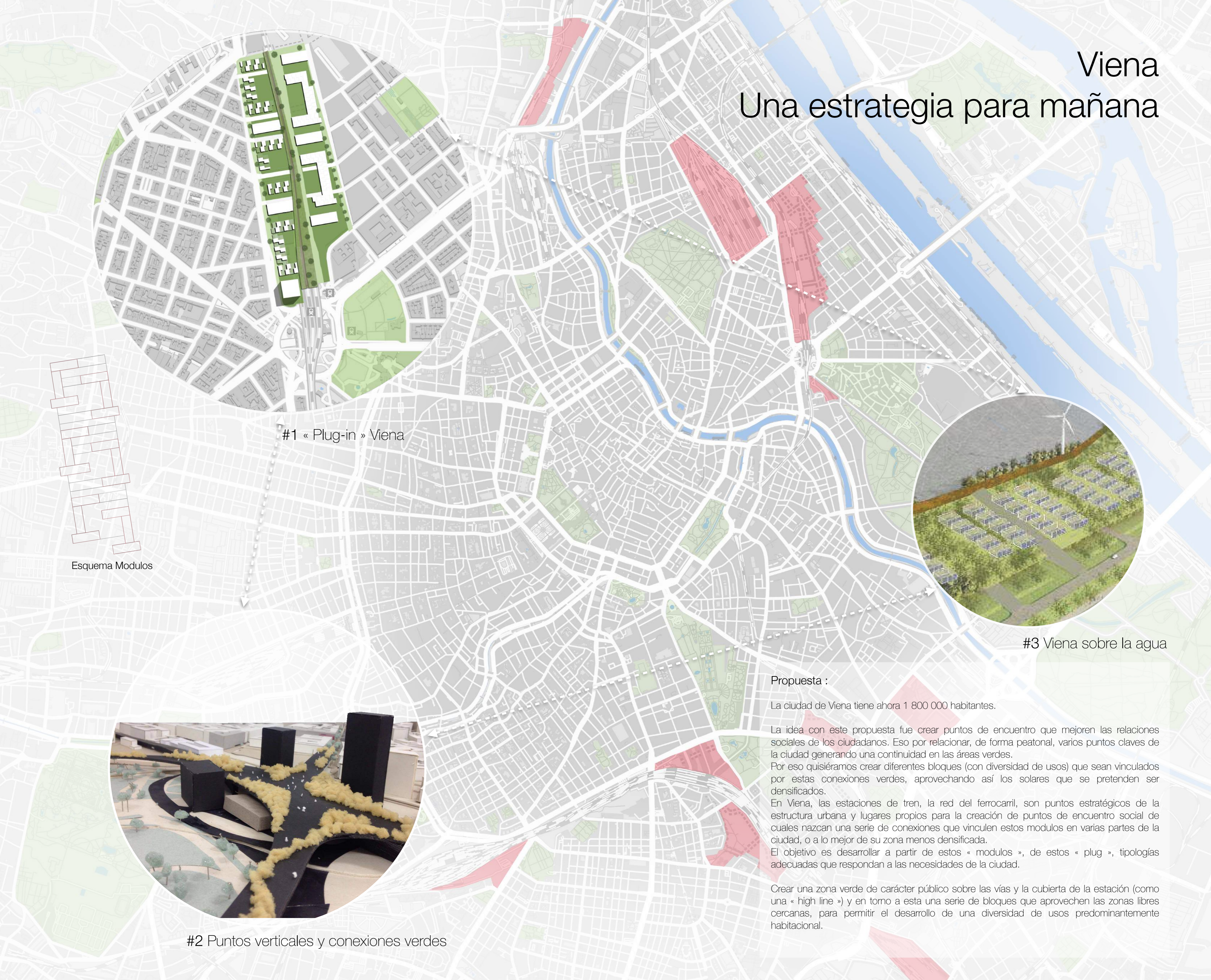
#1 « Plug-in » Viena