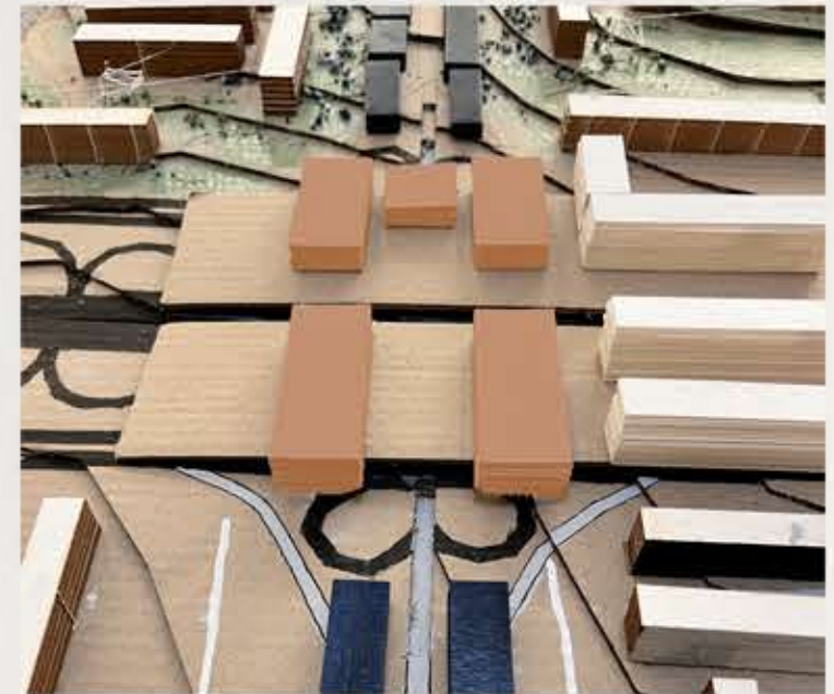
NÚCLEO DE USOS MIXTOS.