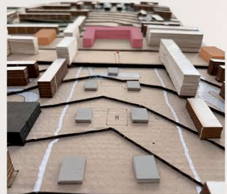
VISTA DE HUERTO URBANO A ZONA ADMINISTRATIVA.