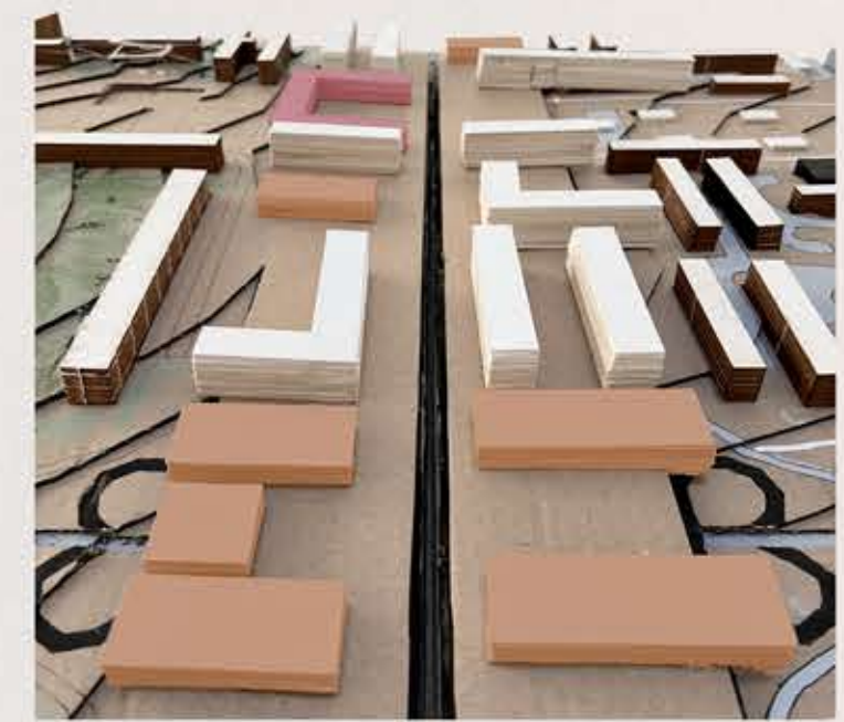
VISTA HACIA EJE PRINCIPAL.

Por último, aspiramos a crear una ciudad de media milla, es decir, un entorno donde las distancias cotidianas no superen este rango. Las paradas de metro y autobús estarán ubicadas a media milla o menos, y los servicios y equipamientos esenciales se encontrarán dentro de ese mismo radio.