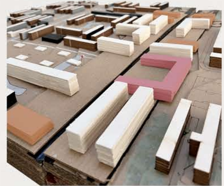
PERSPECTIVA GENERAL DE INTERVENCIÓN.