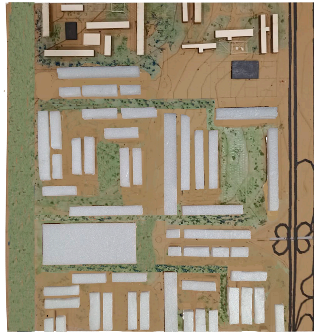
Fotomontaje del proyecto.