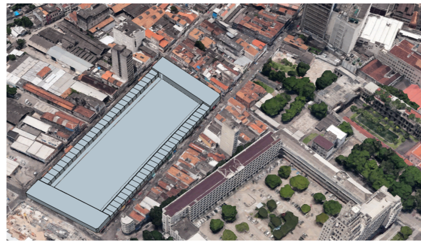
TEJIDOO I _PARCELARIO DE 60VIV/ha

Para el proyecto de las 60 viv/ha, hemos decidido hacerlo en dos tipologías diferentes para ocupar menos parte de la manzana existente.