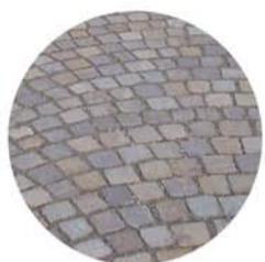
PAVIMENTO ÚNICO PROPUESTO