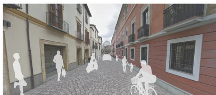
VISTA DE LA PROPUESTA