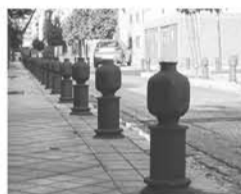
ELIMINACIÓN DE LOS BOLARDOS