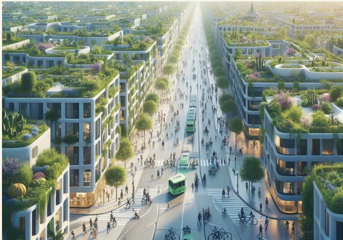
CAMINO DE RONDA