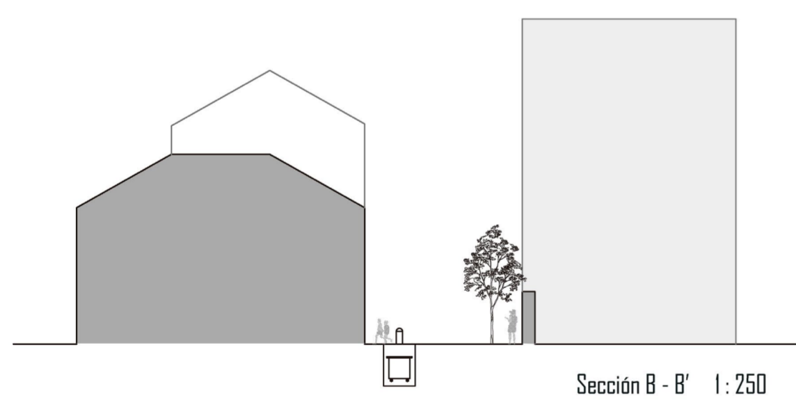
Sección B - B' 1: 250