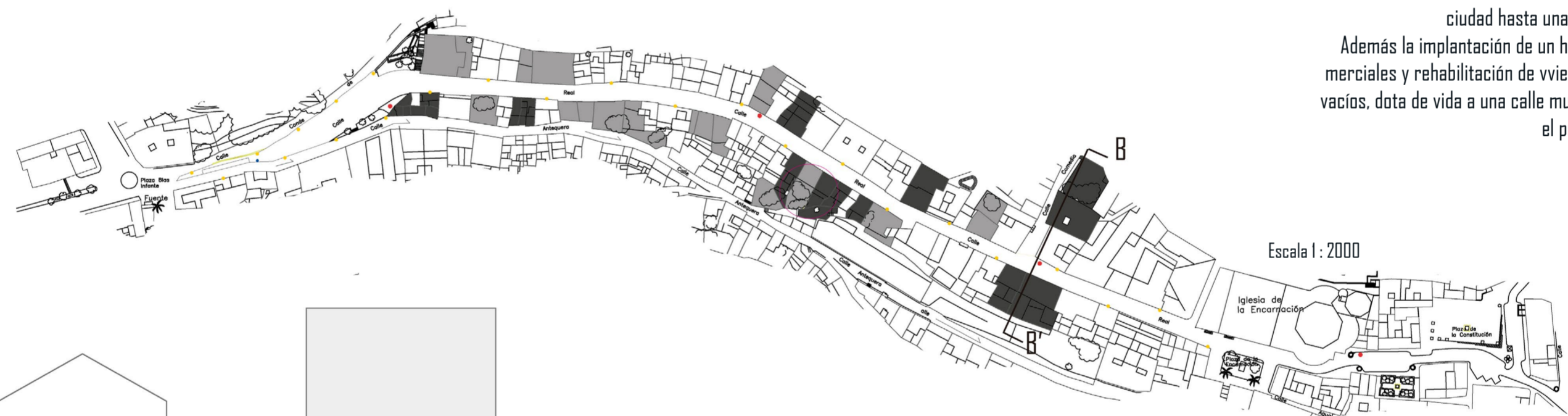
Escala 1: 2000

El proyecto crea un eje, siendo este la Calle Real de Loja, uniendo la Plaza de la Encarnación y una nueva plaza/mirador en el encuentro con la calle Antequera. Los materiales utilizados principalmente son el travertino para el pavimento, ya utilizado en algunas aceras de la calle a tratar, y el acero corten y madera para el mobiliario urbano usado en la calle. La calle se corta al tráfico desde el encuentro con la Calle Antequera, hasta la plaza de Constitución, exceptuando a residentes y transporte urbano, creando así una plataforma única continua en la que los peatones son los protagonistas de esta, haciendo un recorrido desde el casco más histórico de la ciudad hasta una plaza/mirador. Además la implantación de un hotel, locales comerciales y rehabilitación de viviendas y espacios vacíos, dota de vida a una calle muy castigada por el paso de los años.