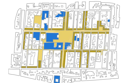
usos de suelo