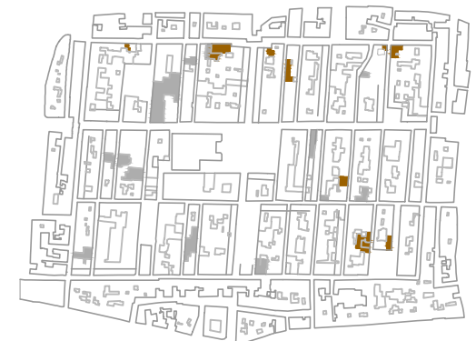
zonas de intervención