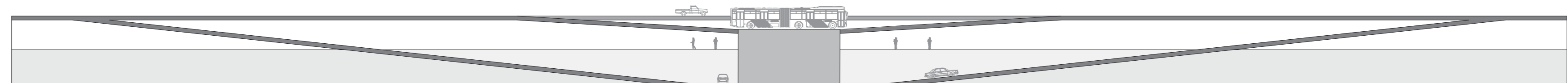
Sección longitudinal núcleos de comunicación