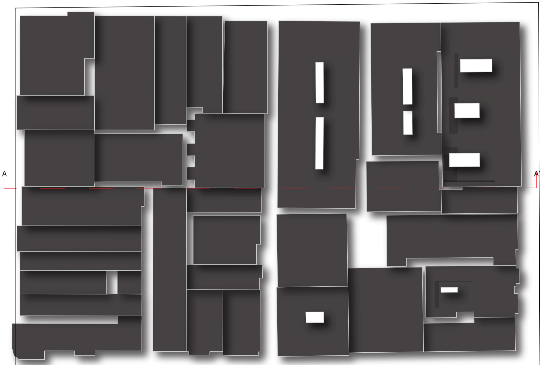
Planta E 1/500

Tipologias de costucion: casa en hilera/pareada, bloque a patio cerrado